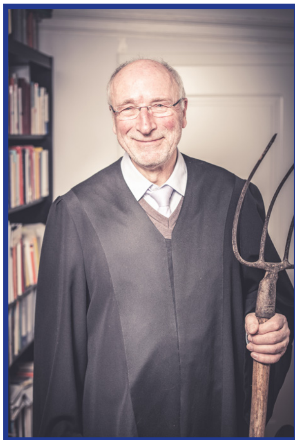
Die Fotokampagne Stadt und Land verbinden wurde durch den Autor initiiert und thematisiert sowohl die Entfremdung unserer Nahrungsmittelproduktion als auch die Relevanz einer Landwirtschaft unter Bürgerbeteiligung.

Für Castoriadis ist die schöpferische Einbildungskraft des Menschen eine unerschöpfliche Quelle von Neuem und nie erlahmende Triebkraft der gesellschaftlichen Veränderung. Die Gesellschaft, ihre Geschichte und ihre Identität sind bei Castoriadis imaginär: Sie sind zunächst rein virtuell, formlos und diffus. Erst durch den Prozess ihrer „Instituierung“ nehmen sie ihre konkrete Form als gesellschaftliche Institutionen an. Metaphorisch verwendet Castoriadis für diesen Prozess das Bild des „Magma“. Aus dem flüssigen und formbaren Magma, der unbegrenzten Vorstellungskraft des Menschen, formt jede Gesellschaft sowohl ihre Institutionen als auch ihre sozialen Sinnzusammenhänge. Gleichzeitig kann das gesellschaftliche Magma zu bestimmten Formen erkalten und sich verfestigen. Die Regionalwert AG kann als Unternehmung verstanden werden, die erkaltete Strukturen hinterfragt und damit verflüssigt, aber auch neue institutionelle Ansätze prägt und verfestigt. Zum Beispiel verfolgt die Regionalwert AG den Ansatz, externe Faktoren wie Biodiversität, Bodenfruchtbarkeit oder die Ausbildung von Lehrlingen ebenfalls als Werte in die Unternehmensbilanz mit einzubeziehen. Während das soziale, ökologische und regionalökonomische Engagement in der klassischen Bilanz eines Betriebes keine Rolle spielt, wird dieses bei der Regionalwert AG in über 40 Kategorien aufgeschlüsselt und in der Bilanz der Partnerbetriebe gleichwertig mit den finanziellen Einnahmen und Ausgaben aufgeführt.