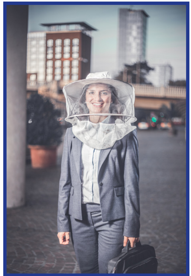
Was hat eine Finanzanalystin mit Bienen am Hut?